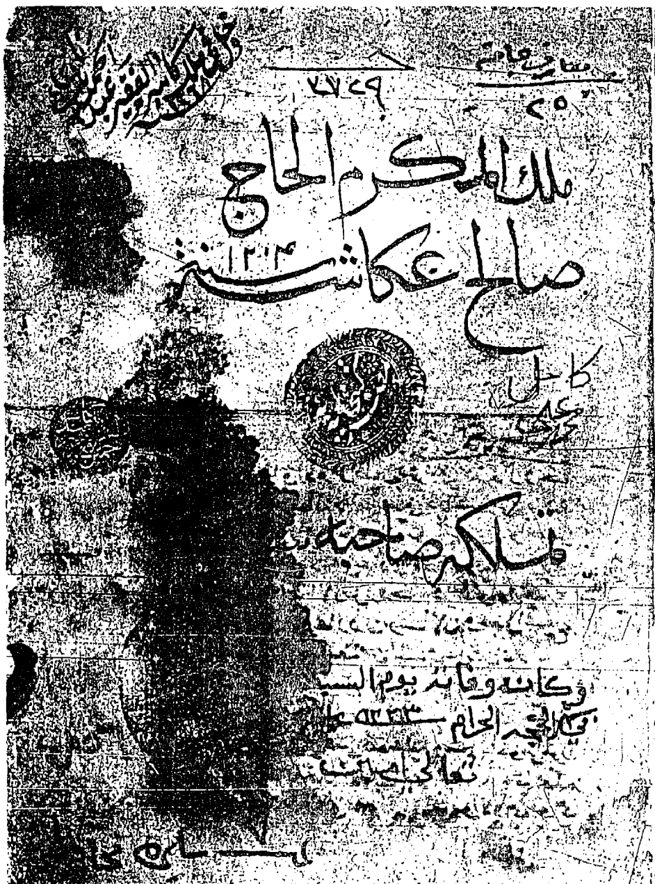
صورة صفحة الغلاف لمخطوط الإشارات في علم العبارات